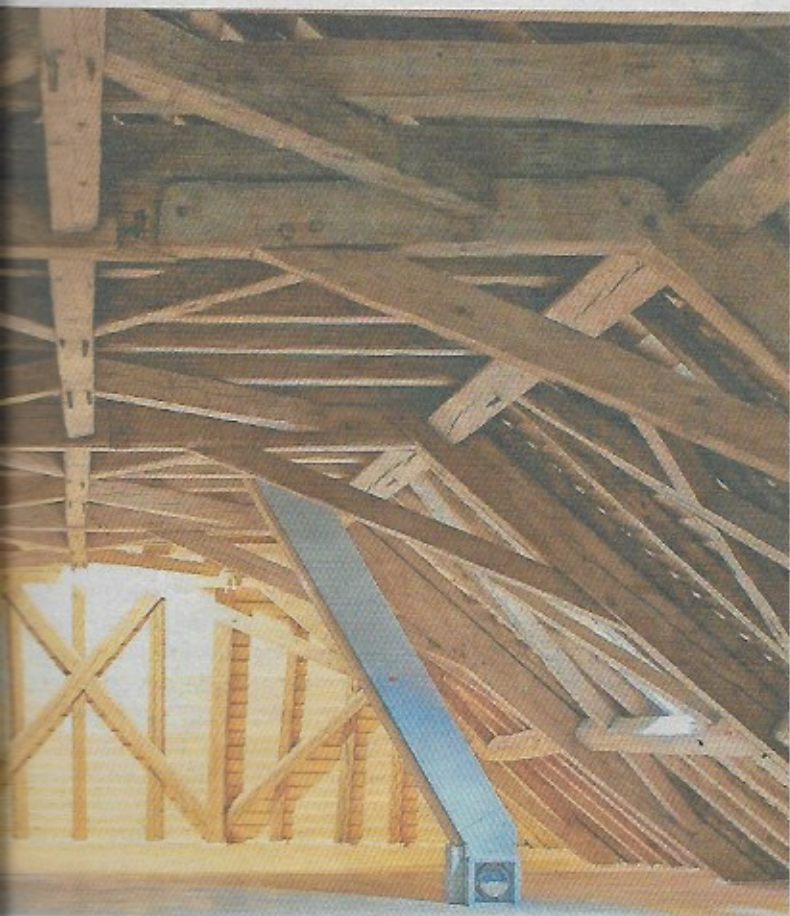
Dépourvue d'isolation, la charpente se laisse admirer.