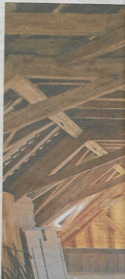
Cet espace a été aménagé pour manger... mais pas toute l'année vu que ce n'est pas chauffé