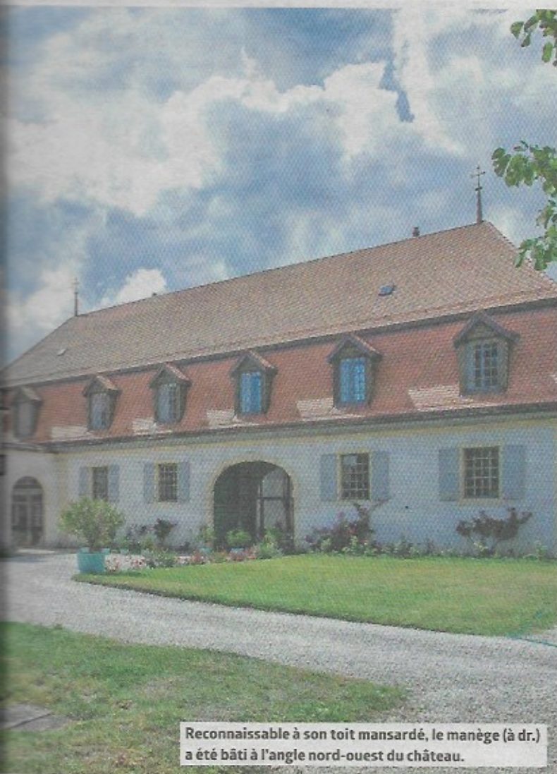
Reconnaisable à son toit mansardé, le manège (à dr.) a été bâti à l'angle nord-ouest du château.